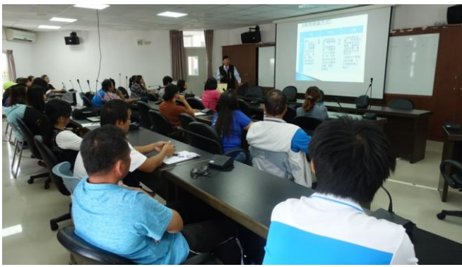
許檢察官辦理反賄宣導情形