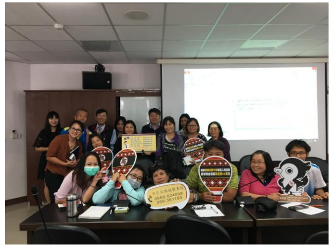
現場鄉民支持反賄選大合照