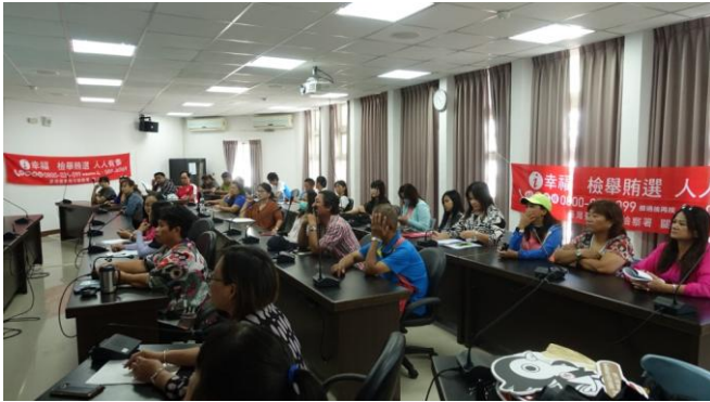
現場民眾熱烈參與