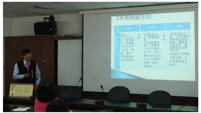
許檢察官詳述常見賄選方式