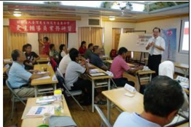
檢察長黃玉垣致詞