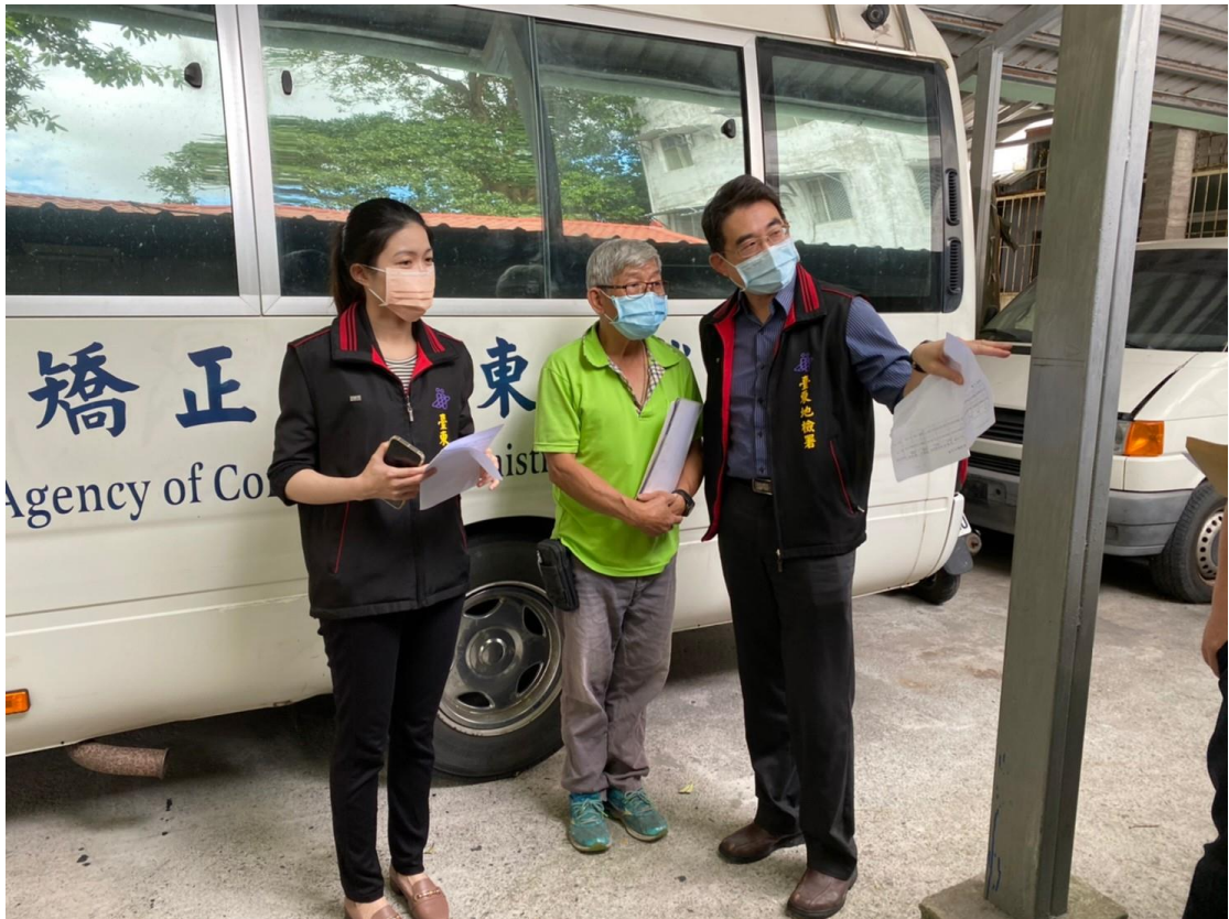
林檢察官、許主任觀護人與現場管理人員談論社會勞動業務。