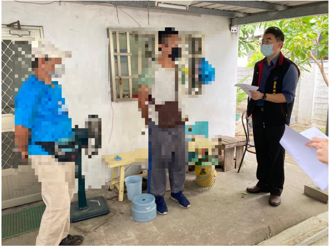
許主任觀護人鼓勵及關心社會勞動人執行狀況，執行時務必注意安全。