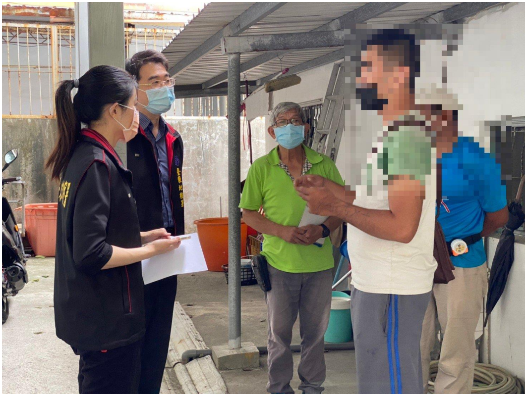
傾聽社會勞動人的困境，鼓勵社會勞動人如期完成社會勞動。