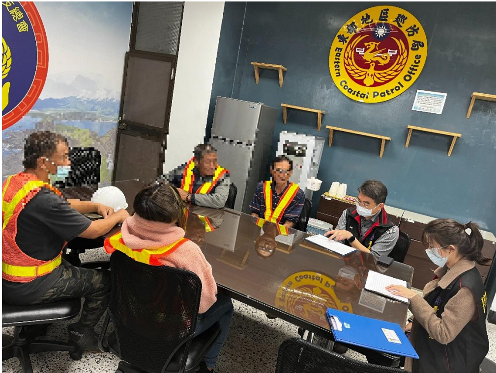
林檢察官、許主任觀護人與現場社會勞動人， 詢問社會勞動是否有任何疑問及關心執行狀況，執行時務必注意安全。