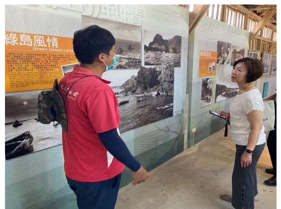
說明：參訪白色恐怖綠島紀念園區