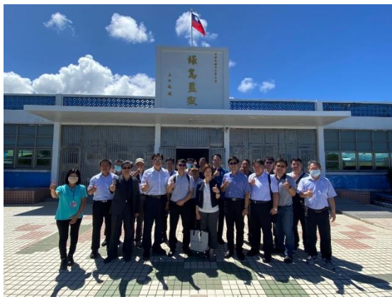
說明：訪視綠島監獄