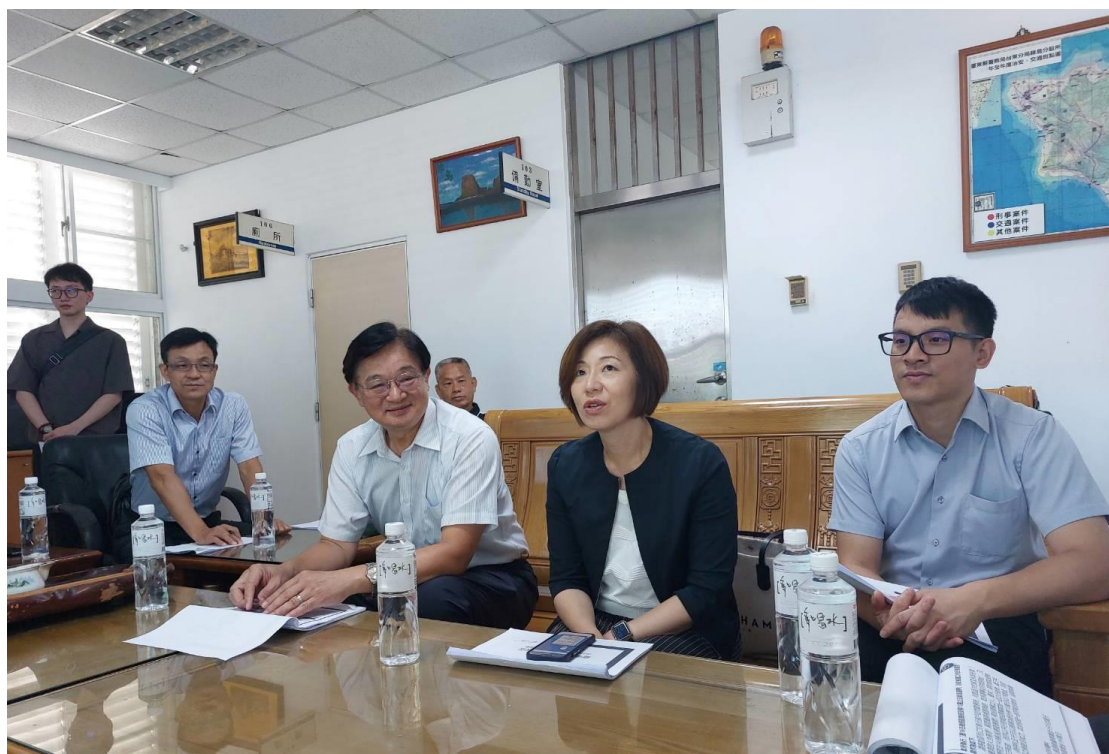
說明：綠島分駐所選舉查察座談會

本署再度宣示，將全力防止各種妨害選舉不法作為，本署亦設有檢舉妨害選舉電話專線：(089)361169，傳真電話(089)327442，免費檢舉專線0800-024-099，檢舉電子信箱tten@mail.moj.gov.tw，檢舉信箱：臺東郵政第115號。